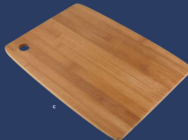
Tabla para cortar. La madera es un producto natural el cual puede presentar variaciones en tonalidades y vetas.