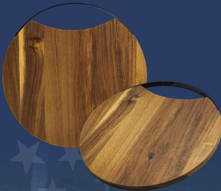
Tabla redonda para cocina con asa metálica en color negro. Incluye caja individual. La madera es un producto natural el cual puede presentar variaciones en tonalidades y vetas.